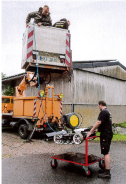
Am Haken aufgehängt setzt ein Helfer das mit Schlauchaufroller über 80 kg schwere Gerät auf einen selbst konstruierten Rollwagen ab.