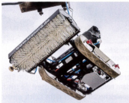
Ein Blick von unten: Die Bürste hat 30 cm Durchmesser.