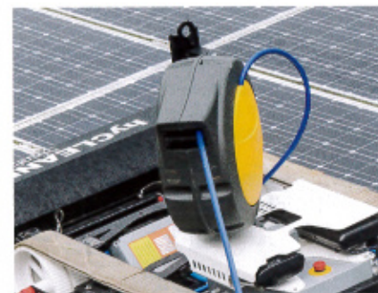
Der Schlauchaufroller wickelt 20 m Wasser-schlauch automatisch auf.

presse wird dann das Wasser aus den Bändern herausgedrückt. Und damit die frisch gewaschenen Bänder nicht gleich wieder dreckig werden, putzen die Mitarbeiter von SRS Nord am Startpunkt des hyCleaners die ersten vier Module von Hand.