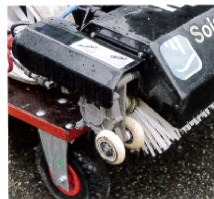
Die kleinen Stützräder vorne heben die Bürste beim Überfahren von Gängen an und verhindern, dass der Elektromotor des Bürstenantriebs auf die Module aufsetzt.