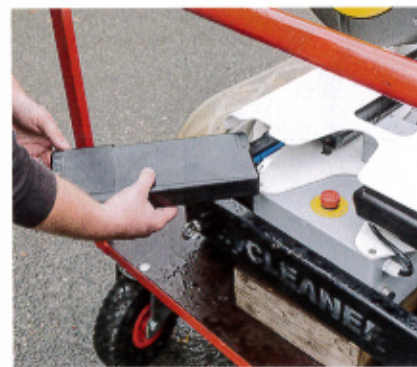
Die Li-Ionen-Akkus gibt es im freien Handel (z. B. auch im Fahrradgeschäft).