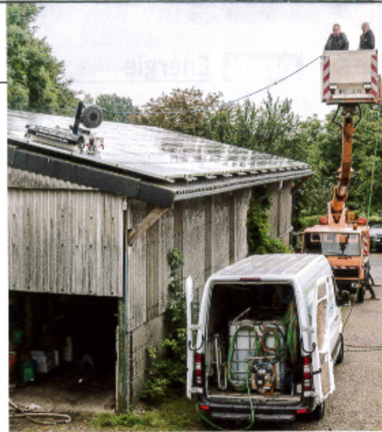
Das Solarreinigungsteam von SRS Nord ist immer zu zweit unterwegs und bringt auch einen Hubsteiger, entmineralisiertes Wasser sowie eine Pumpe mit.