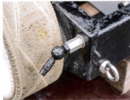
Die Düse sprüht zum Vorweichen Wasser auf die Module. Sie lässt sich von Hand abstellen.

Das Reinigungsteam von SRS Nord wäscht die Bänder nach jedem Einsatz entweder in der Waschmaschine mit einem speziellen Waschmittel oder auch gleich vor Ort in einem Putzeimer. Mithilfe einer Wischtuch-