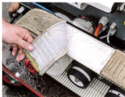
Die Leder-Laufbänder halten mit Klett auf den Raupen-Zahnriemen.