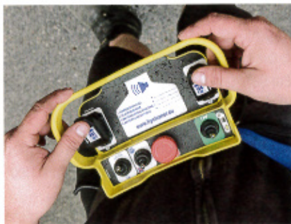
Mithilfe der zwei kleinen Hebel an der Fernbedienung lenkt der Bediener den hyCleaner.

Der hyCleaner black Solar ist modular nach dem Baukastenprinzip aufgebaut. Der Rahmen und die Bürstenhaube sind aus Aluminium gefertigt. Die vorne angebaute Wal-